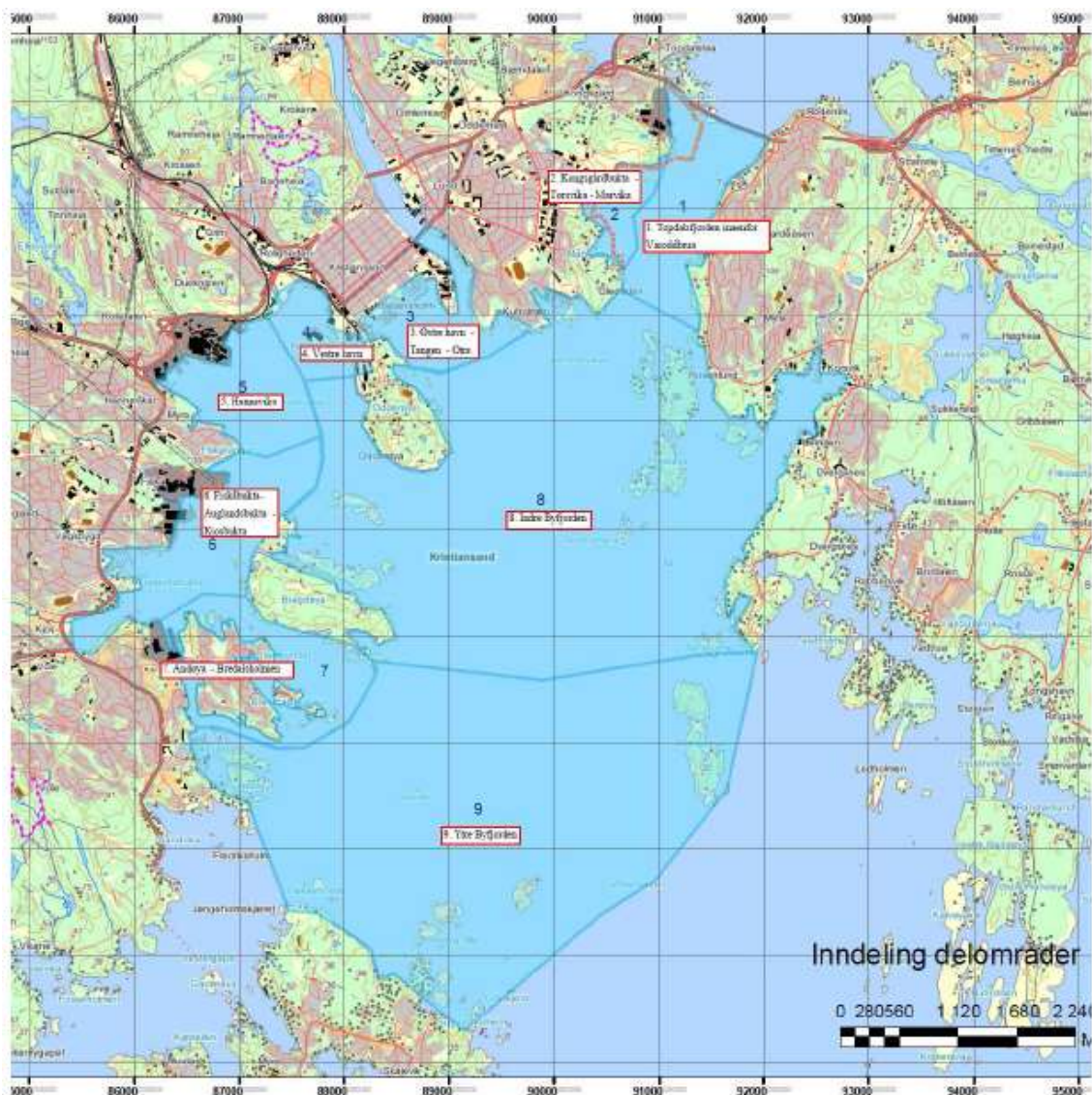
Figur 5. Oversikt over delområder i Kristiansandsfjorden. Kart er hentet fra DNVs rapport: "Revidert tiltaksplan for forurensete sedimenter- Kristiansandsfjorden. 2011."

Det har blitt gjennomført en rekke undersøkelser av forurensningssituasjonen i Kristiansandsfjorden og fram til i dag, men det er tatt utgangspunkt i nyere data som grunnlag for beregningen. Datagrunnlag fra ref. 12-23 er benyttet i beregningene.